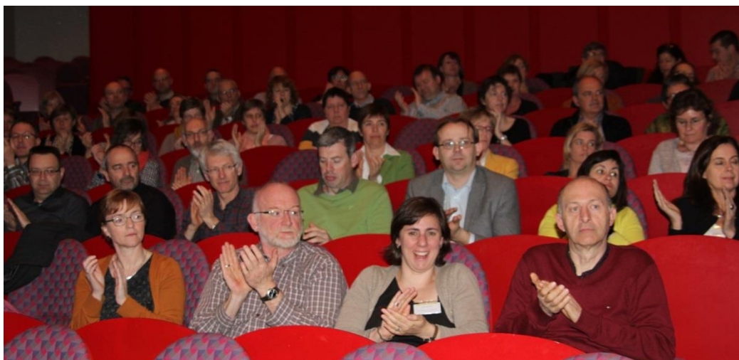
Boven: een enthousiast publiek

Lieven Boeve schetste de context waarin de katholieke dialoogschool vorm moet krijgen, vanuit een kadervisie die de verscheidenheid van projecten inspireert. De maatschappij is de laatste decennia enorm geëvolueerd inzake religiositeit en kerkbetrokkenheid. Bij de nieuwe leerkrachten zijn er amper nog kernkatholieken. In zo'n context van secularisering en superdiversiteit is het een grote uitdaging om ons als katholieke dialoogscholen te organiseren en kwaliteitsvol onderwijs te blijven aanbieden. Liefde is daarbij een belangrijk criterium. Het VSKO plant nascholingsinitiatieven om die werf te kunnen starten in september 2016.