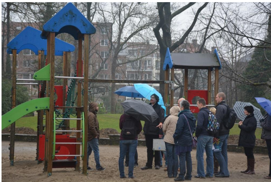
De speeltuin van het Kruidtuinpark (foto boven) had heel wat gebreken. Die van het Scheppersinstituut (foto onderaan) scoorde heel wat beter.

de derde locatie: de openbare speeltuin in het Kruidtuinpark aan de Bruul in Meche-