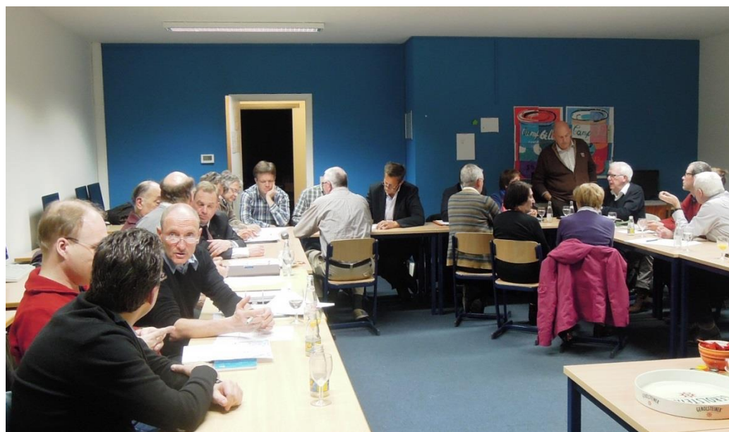
Infovergadering voor de schoolbesturen van Klein-Brabant op 17 maart 2015

Op 17 maart was het de beurt aan de schoolbesturen (zonder directeurs) van de regio Klein-Brabant. 10 van de 11 schoolbesturen waren vertegenwoordigd in het Gildenhuis in Bornem. Het bestuur van het Onze-Lieve-Vrouwinstituut Boom (bisdom Antwerpen) was voor die vergadering niet uitgenodigd, maar is wel verbonden met Klein-Brabant via de scholengemeenschap secundair onderwijs Boom-Bornem-Puurs.