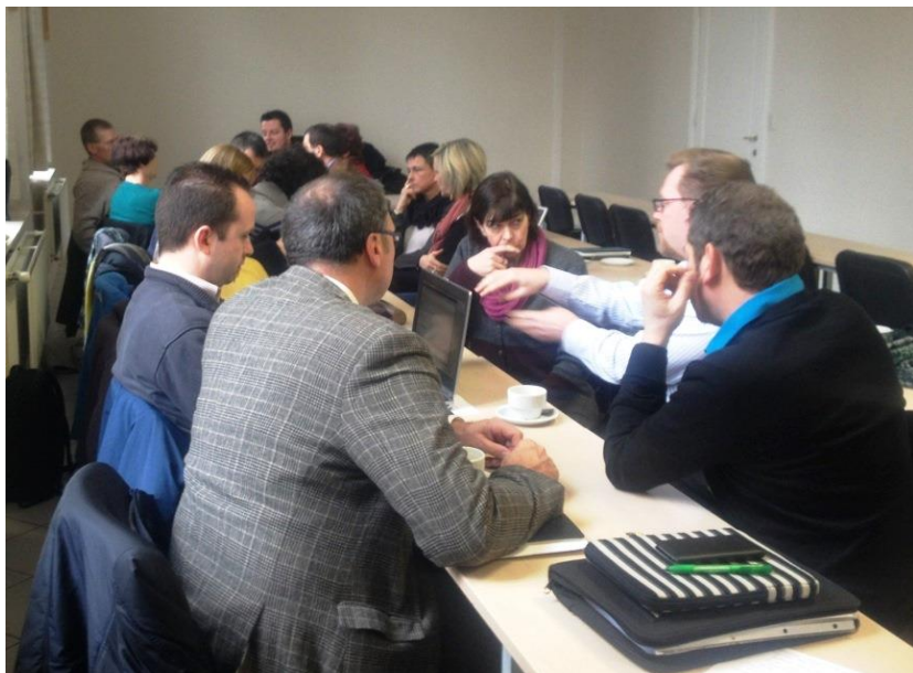
Directeurs met coördinerende opdracht basisonderwijs bespraken met elkaar welke taken ze kunnen opnemen bij het proces van bestuurlijke schaalvergroting. Een dag later deden codi's SO hetzelfde.

dracht, in het basisonderwijs functioneren nog deeltijdse dirco's, al dan niet in duo-baan; in sommige gevallen is er zelfs geen dirco aangesteld maar worden de taken verdeeld over verschillende directeurs, of de dirco blijft voltijds directeur maar krijgt wat administratieve ondersteuning ter compensatie.