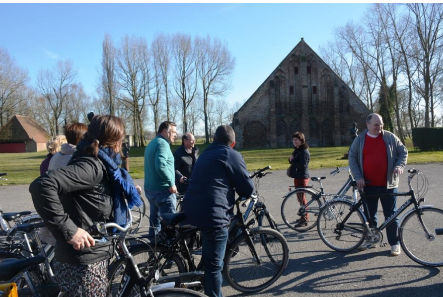
Onder: Recreatief fietsen tot in Lissewege

Soms moeten we kiezen om onze bril kleiner te maken of onze elastiek breder.