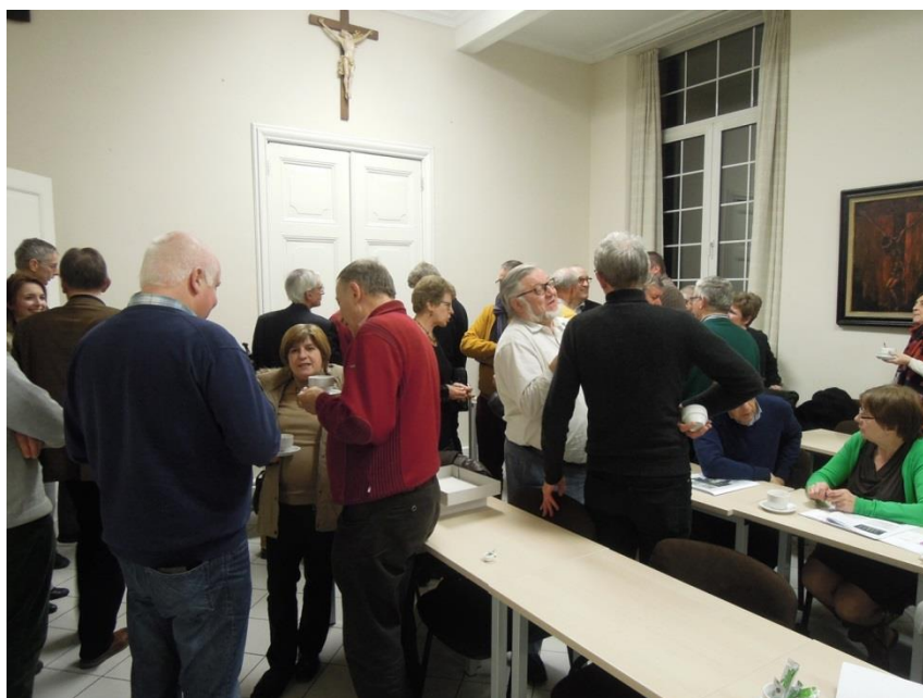
Voorjaarsseminarie in Mechelen op 2 maart 2015