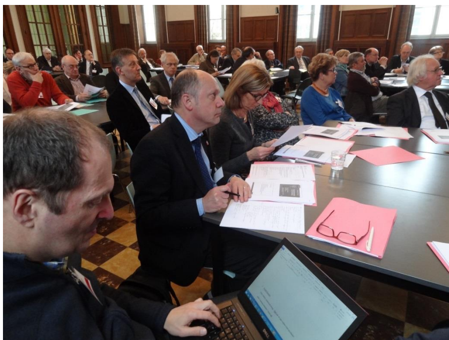
De leden van de diocesane Comités Besturen waren talrijk aanwezig in Drogenen.

Na een pauze konden we in groeps gesprekken aangeven wat we sterk vonden in de uiteenzettingen, wat we wensten