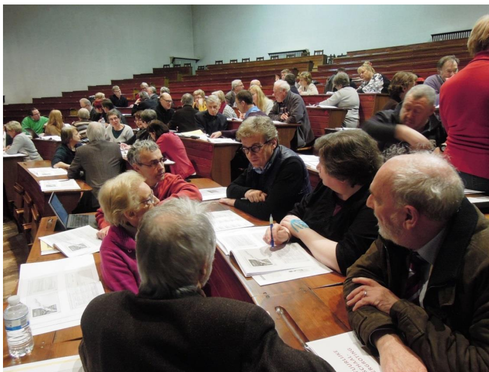
Overleg tussen leden van schoolbesturen tijdens de vormingsavond over bestuurlijke schaalvergroting op 20 januari 2015 in het Diocesaan Pastoraal Centrum in Mechelen.

Het gaat om bestuurlijke schaalvergroting, geen schoolvergroting. De schaalvergroete schoolbesturen zijn, in de visie van het VSKO, solidair met minder fortuinlijke schoolbesturen. Om voldoende schaalgrootte te stimuleren stelt het VSKO een beleid van ‘incentives’ voor, waarvan sommige wettelijk nog niet mogelijk zijn. Het VSKO wil daarover het gesprek aangaan met de overheid. Op die manier zou die solidariteit ook kunnen spelen tussen de onderwijsniveaus. Door middelen en omkadering te herverdelen over de niveaus kunnen basisscholen meer ondersteuning genieten. Qua timing mikt het VSKO op een doorbraak tegen 1 september 2018. Belangrijk aandachtspunt is de gelijktijdige uitstap van alle scholen uit de scholengemeenschap (een functioneel samenwerkingsverband dat in 2020 sowieso ophoudt te bestaan) én de gelijktijdige instap in een (vergroet) schoolbestuur.